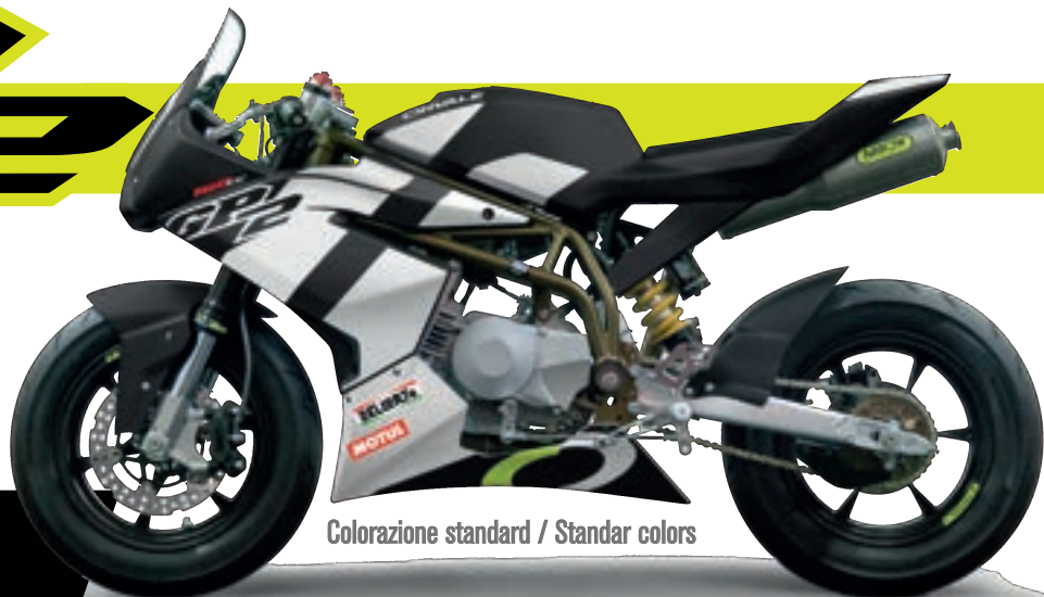
Colorazione standard / Standar colors